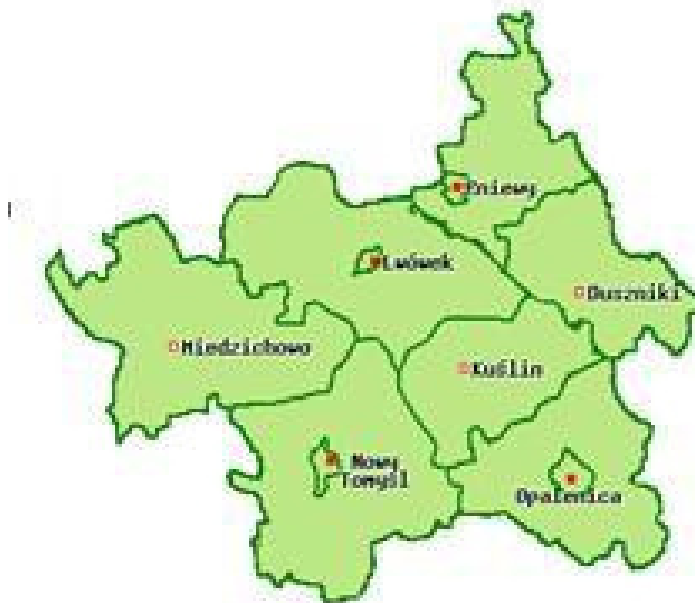
Mapka obszaru LSR z podziałem na gminy